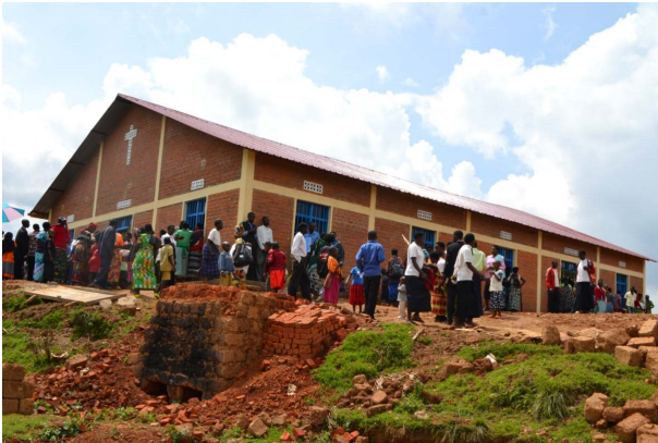
De kerk van Burango na de opening in februari 2014.

toesloeg. In één klas werden 3 leerlingen op slag gedood, in een andere klas 2. De overige leerlingen verkeerden in shock en waren zeer getraumatiseerd.