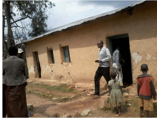
De klaslokalen, waar de leerlingen zijn omgekomen.