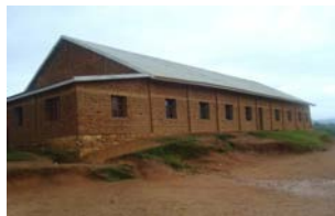
Links, de pastorie, rechts de kerk van Wagishimbiri