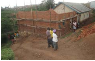
De kerk van de zendingsgemeente Gitwa in heropbouw

De zendingsgemeente Gitwa is gelegen in de cel Shyembe, sector Murambi, district Karongi, Westelijke provincie. Ze grenst aan de gemeenten Munanira, Mubuga en Kirinda, alle van de presbyterie Kirinda.