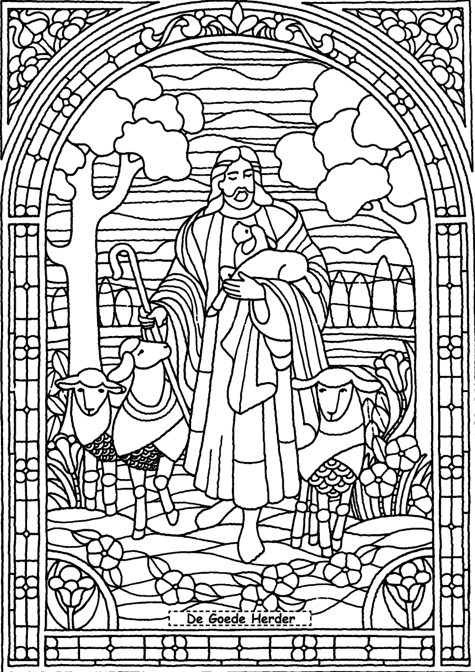
De Goede Herder