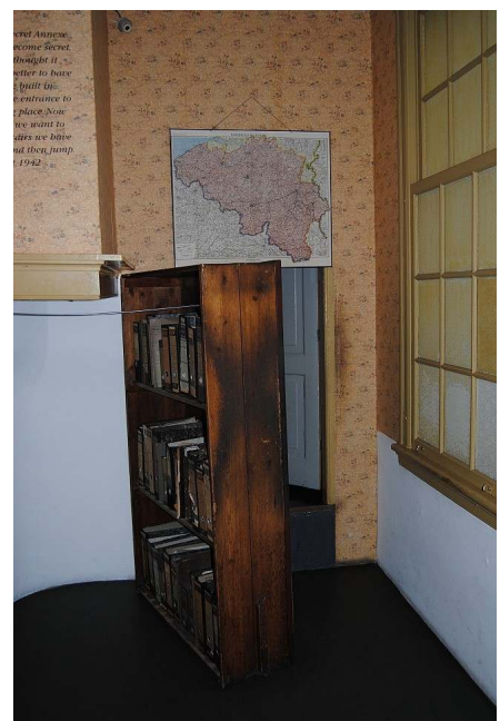
Doorgang naar de schuilplaats