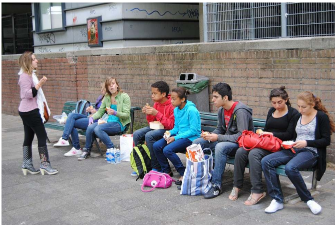
Lunch aan de Amsterdamse grachten

Dan zijn we gaan eten en na het eten gingen we naar Anne Frank en we moesten heel lang aanschrijven.