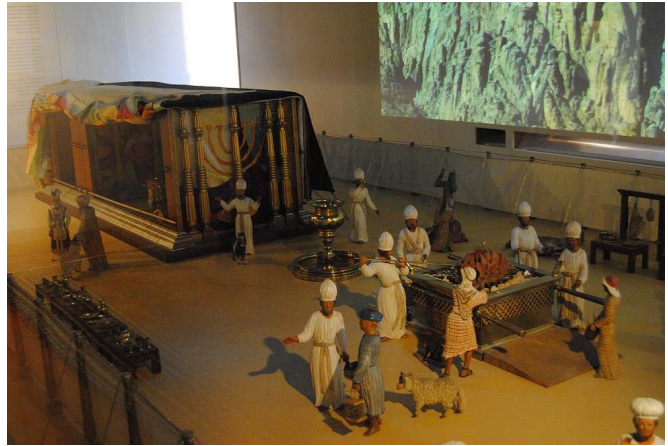
Een model van de tabernakel

Toen we aankwamen, zochten we de weg naar het Bijbels Museum. Oh daar was het, het was vrij klein en we hebben een filmpje over de ark gezien.