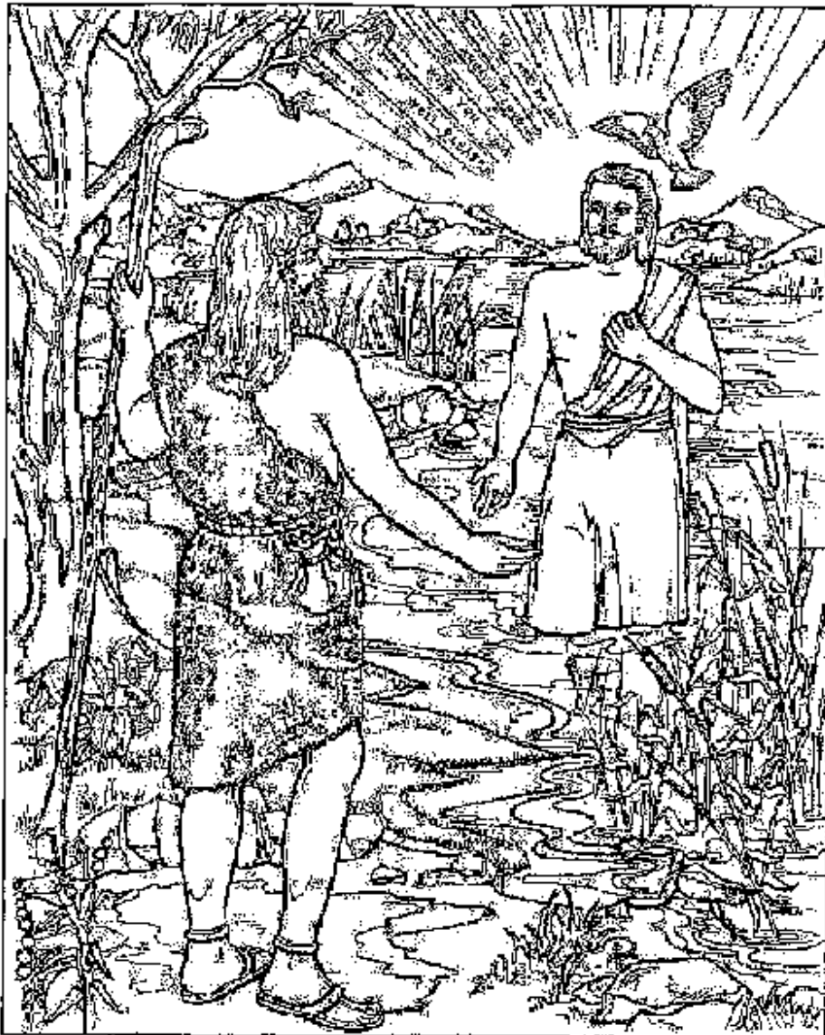
Jezus wordt door Johannes gedoopt - Mattheüs 3 : 16 Kijk voor nog meer bijbelse kleurplaten op www.gkvapeldoornzuid.nl

Bijbelkleurplaten - Jezus wordt door Johannes gedoopt - Mattheüs 3 : 16