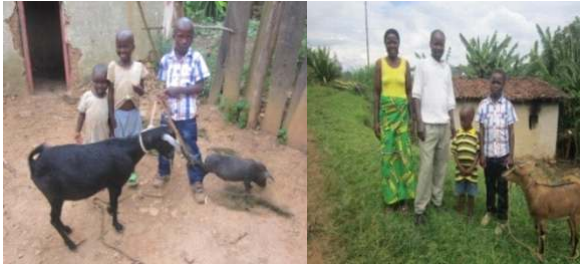
Verdeling van kleinvee in het kader van verbetering van levensomstandigheden van arme gezinnen.