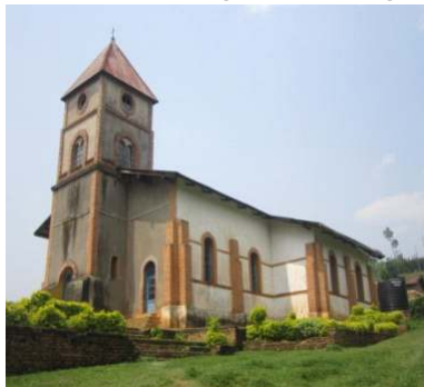
Kerk van de gemeente Kirinda uit 1926.

In deze beknopte voorstelling van de gemeente Kirinda, willen we de volgende punten in ogenschouw nemen: ligging van de gemeente, haar geschiedenis, haar bevolking, bestuur, evangelisatie, sociale activiteiten, de grote uitdagingen en hun beoogde oplossingen.