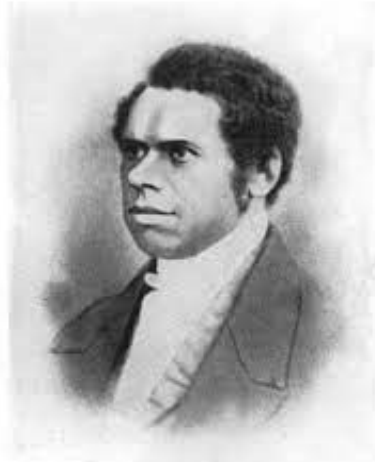
THOMAS BIRCH FREEMAN

In 1842 arriveerden Thomas Birch Freeman (1809-1890) en Henry Townsend (1815-1886) te Badagry in het huidige Nigeria. Thomas Birch Freeman was in Engeland geboren als zoon van een Afrikaan en een Engelse. Hij werkte vooral in de Goudkust (thans Ghana), waar hij talloze scholen en methodistische kerken