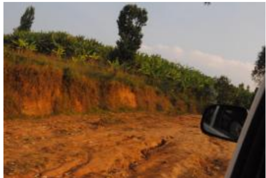
Een verbreed gedeelte van de 'hoofdweg'

Op zaterdagmorgen vertrekken we uit Rubengera, niet ver van het Kivu-meer. De eerste kilometers verlopen vlot, de geasfalteerde wegen zijn hier van goede kwaliteit. Maar als we de afslag naar Itabire nemen, wordt al gauw duidelijk waarom we een terreinwagen hebben gekozen om als vervoermiddel te dienen. De asfaltweg maakt plaats voor een zandweg, waar de regenstromen duidelijk hun sporen op hebben achtergelaten. Zelfs met onze 4x4 en de ervaren chauffeur komen we maar zelden aan een snelheid van 30 kilometer per uur.