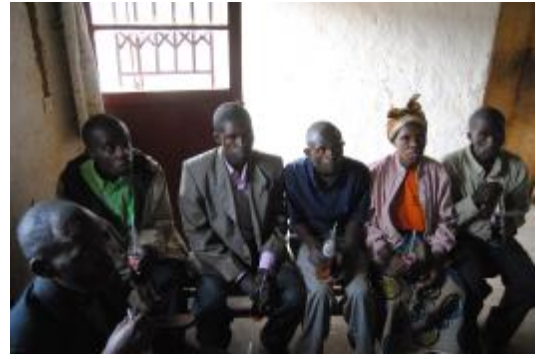
De kerkenraad van Musango

De gemeente Musango geeft dan globaal eenzelfde beeld als Biguhu: een allerhartelijkste ontvangst door de kerkenraad (met het onvermijdelijke flesje Fanta) - de blaas wordt met alle gehobbel onderweg wel erg op de proef gesteld. Hier tobt men met het probleem, dat veel gemeenteleden zijn weggetrokken vanwege de betere leefomstandigheden elders. Er zou een gastenverblijf kunnen worden gebouwd om financieel het hoofd boven water te houden - maar eerlijk is eerlijk: veel heeft de streek aan toeristen niet te bieden. De bereikbaarheid is verre van ideaal, water wordt met jerrycans aangevoerd, en ook het elektriciteitsnet heeft Itabire nog niet bereikt.