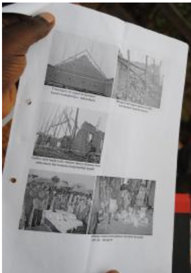
De tragedie in Burango

De opzet van het bezoek is om in korte tijd met zoveel mogelijk verantwoordelijken van de kerkelijke gemeenten kennis te maken. Eerst worden we ontvangen door de kerkenraad van Biguhu met een flesje Fanta. Na een korte introductie volgt een toer door het dorp, waarbij ook vol trots het gezondheidscentrum wordt getoond, dat onlangs met steun van 'ons' Kerk en Wereld is gebouwd. Hoewel niet groot van formaat een kliniek waar alle noodzakelijke voorzieningen aanwezig zijn en die een onmisbare rol speelt bij de geboorte van kinderen, de opvolging van hun gezondheid en groei, en een eerste diagnose van ziekten en kwalen. Behalve de kerk, die gemakkelijk enkele honderden gelovigen kan bevatten, wordt ook de school, compleet met internaat en school-koel, bezocht.